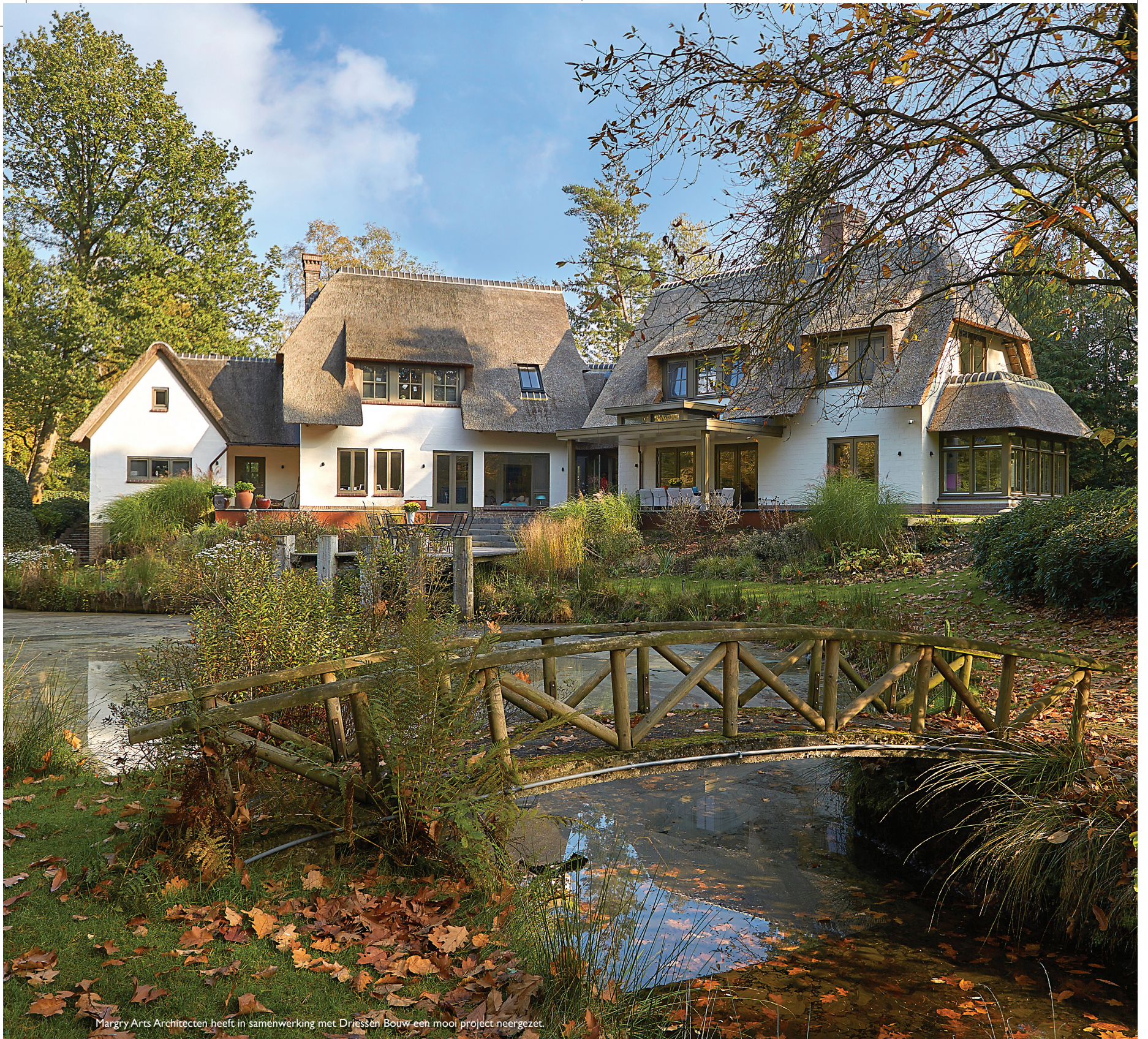
Margry Arts Architecten heeft in samenwerking met Driessen Bouw een mooi project neergezet.