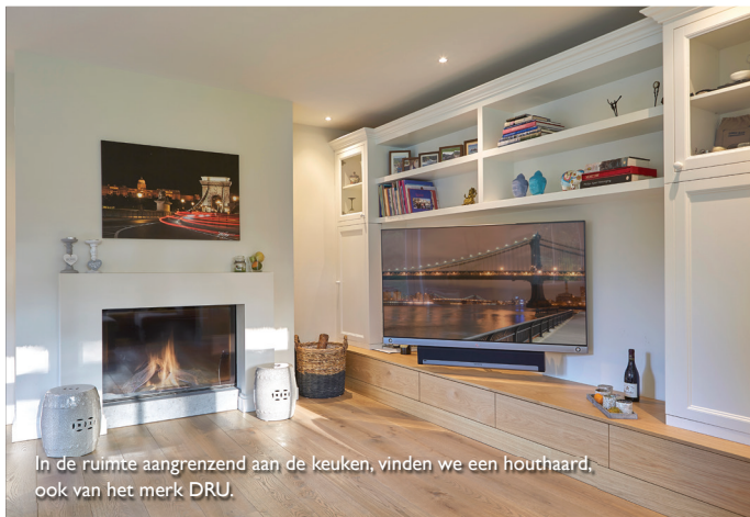
In de ruimte aangrenzend aan de keuken, vinden we een houthaard, ook van het merk DRU.

man houdt van de sfeer van een houtvuur, zelf ben ik vooral van het comfort”, aldus de bewoonster. Voor de domotica, verlichting en elektra deden zij en haar man een beroep op Elektro Speciaal Sprengers. Het installatiebedrijf van de Gebroeders Wijnen uit Valkenswaard leverde naar volle tevredenheid het sanitair (badkamer en toilet), de vloerverwarming en een warmteterugwinstsysteem.