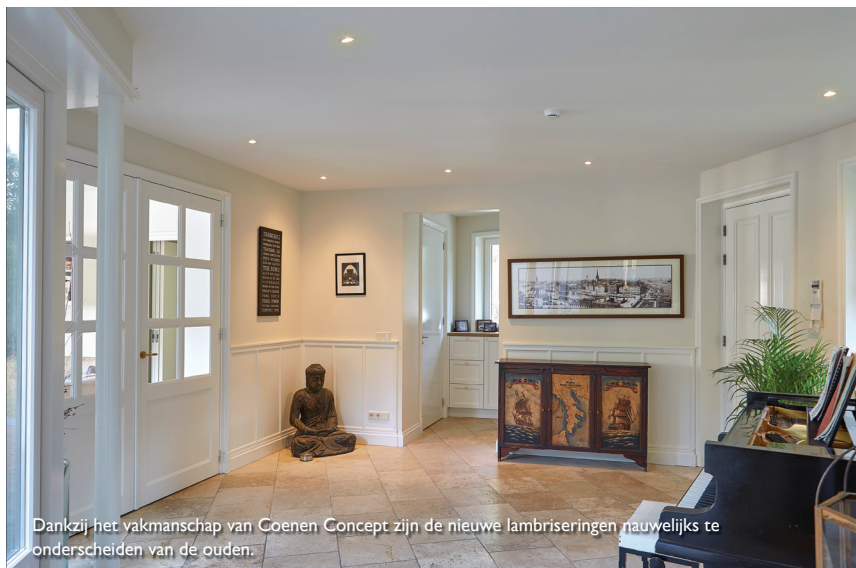
Dankzij het vakmanschap van Coenen Concept zijn de nieuwe lambriseringen nauwelijks te onderscheiden van de ouden.

"Het meest geslaagd aan het project? Ondanks de ruime aanbouw is het nog altijd één huis"