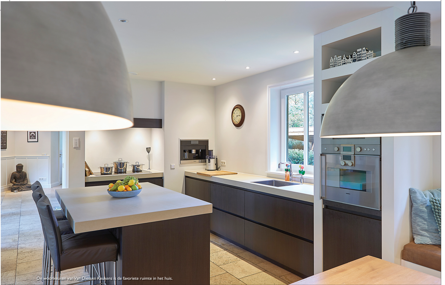
De woonkeuken van Van Diessen Keukens is de favoriete ruimte in het huis.

ze zijn geweldig!” Dankzij hun vakmanschap zijn de nieuwe lambriseringen nauwelijks te onderscheiden van de oude. Ze maakten op de overloop een kast met louvredeuren en realiseerden in de keuken een op maat gemaakte ombouw voor de koelkast. Die woonkeuken – waarin Van Diessen Keukens een belangrijk aandeel had – is overigens de favoriete ruimte in huis. “Vooral de vensterbank is in trek”, vertelt de bewoonster. “Dat was een idee van mezelf. Als de kinderen thuiskomen ploffen ze daar neer.” Een DRU gashaard, geleverd door Sfeerhaarden De Kempen, zorgt er voor extra comfort. In het aangrenzende vertrek, met erker en een eiken vloer geleverd door Esco Vloeren, is dat een houthaard. “Mijn