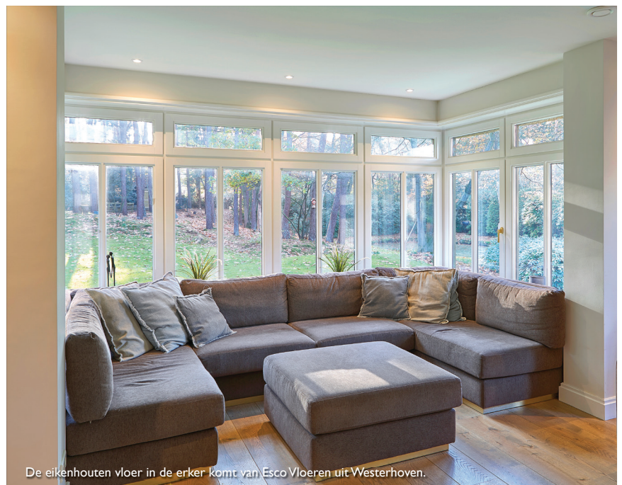
De eikenhouten vloer in de erker komt van Esco Vloeren uit Westerhoven.