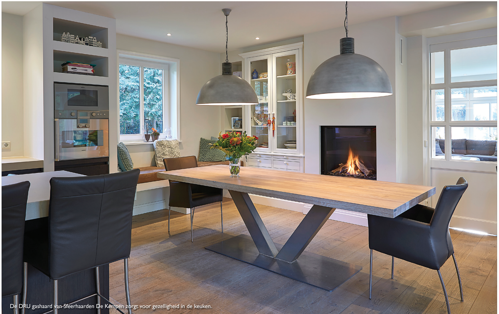
De DRU gashaard van Sfeerhaarden De Kempen zorgt voor gezelligheid in de keuken.