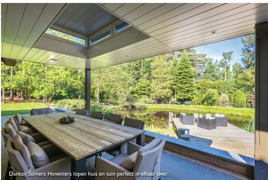
Dankzij Somers Hoveniers lopen huis en tuin perfect in elkaar over.

Tekst: Janneke Sinot